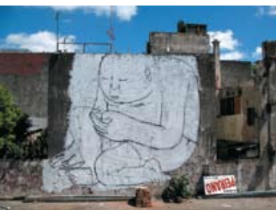
Ratos de rua e