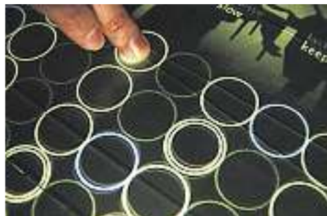
Som. O usuário toca uma nota da escala musical