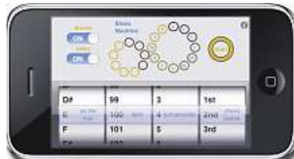
Download. O projeto de blues tem uma versão para iPhone