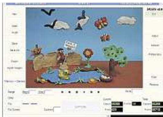
Lúdico. O programa Muan, que permite fazer animação stop motion, foi criado para as oficinas do Anima Mundi